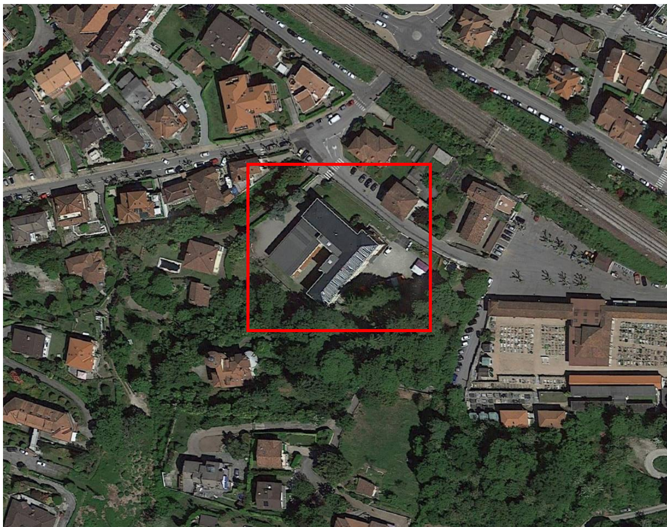
Estratto Ortofoto con individuazione della Scuola Clemente Rebora