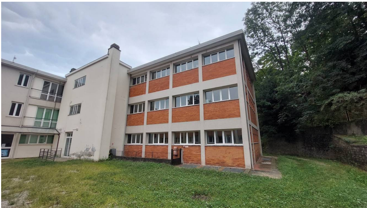
Prospetto nord – ovest con accesso alla centrale termica, a destra l'intercapedine oggetto di intervento