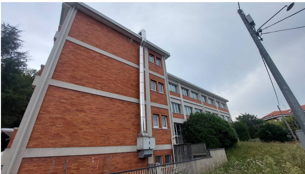
Prospetto Nord – est verso Via Fogazzaro, con vista degli impianti esterni della cucina