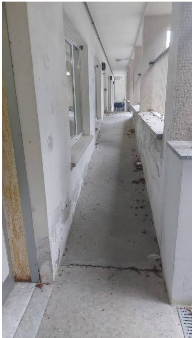
Dettagli dell'accesso al refettorio dal cortile posto verso Via Fogazzaro