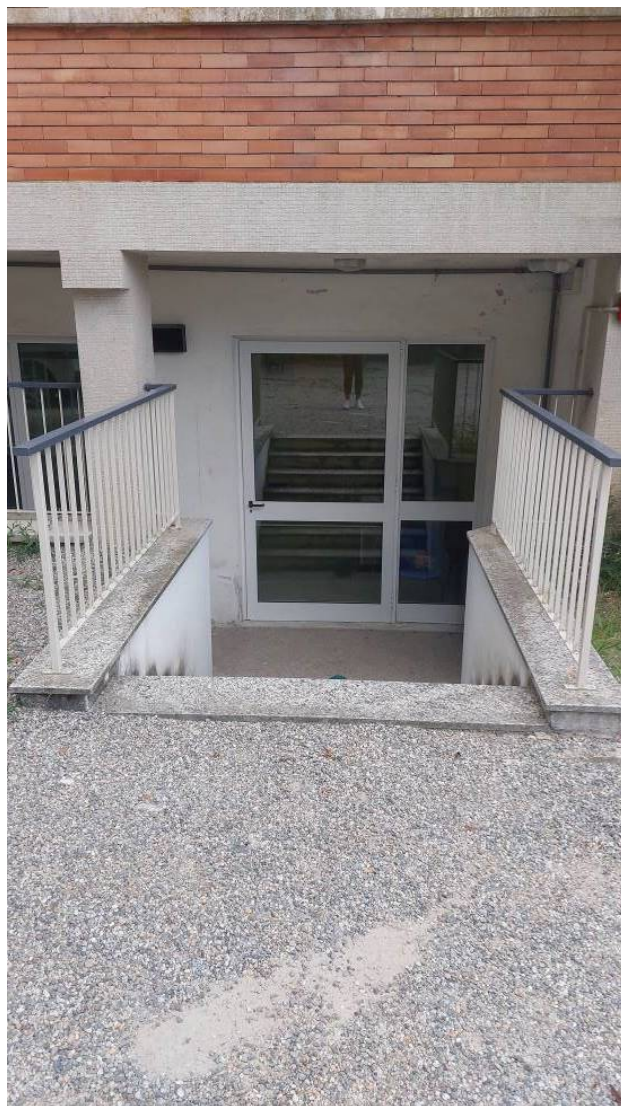
Dettagli dell'accesso al refettorio e dell'ingresso alle aule dal cortile posto verso Via Fogazzaro