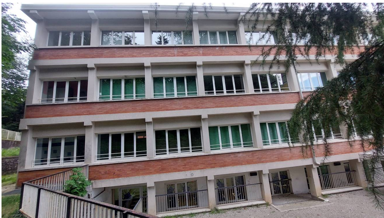
Prospetto Sud –Est e cortile principale, sulla sinistra la porzione controterra da riqualificare