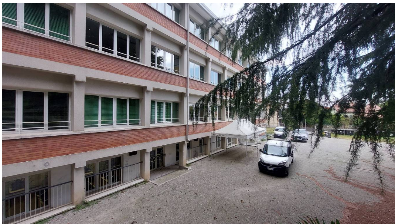
Dettaglio Prospetto Sud –Est e cortile principale, e dell’accesso al refettorio