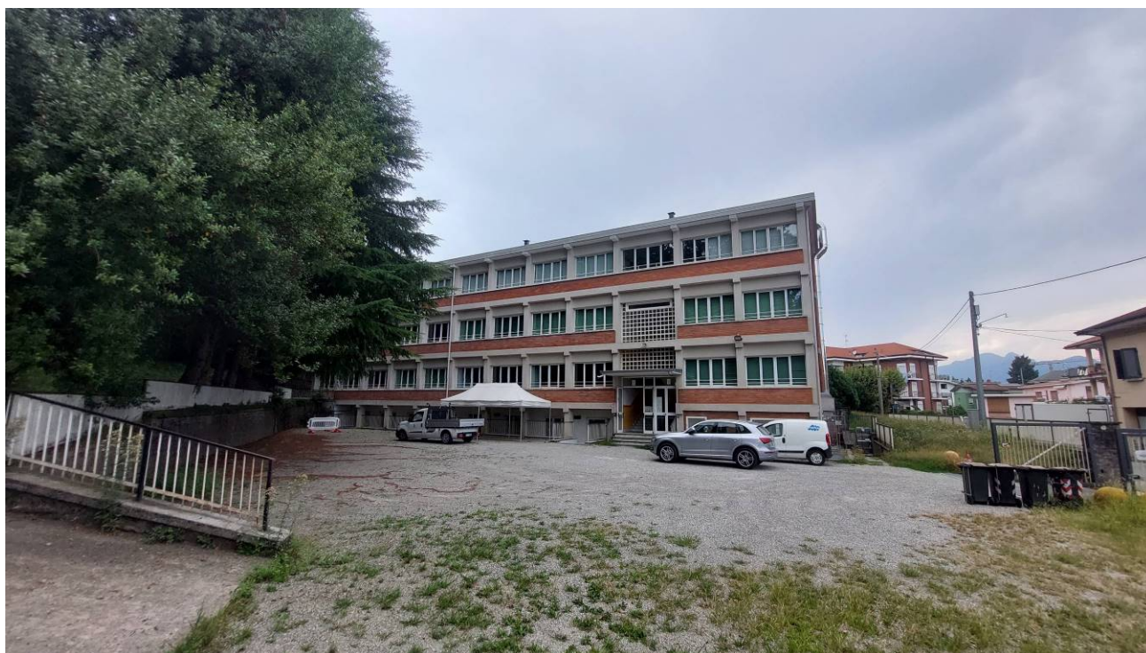
Prospetto Sud –Est e cortile principale, nel piano seminterrato l’accesso al refettorio