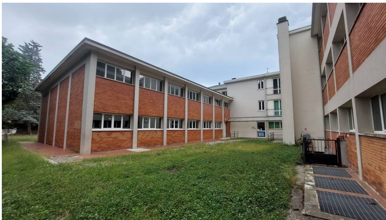
Cortile interno e prospetto nord – ovest con accesso alla centrale termica